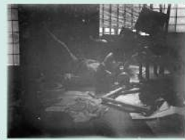
アトリエの萬鉄五郎 (小石川) 1911 (明治44) 年画

明治末から大正期に活躍した画家・萬鉄五郎は、自らカメラを用い、少年期から断続的に撮影を行っていた事でも知られています。本展では、萬が写した、写された写真に注目し、彼の残した作品や資料を加え、その生涯と表現を辿ります。